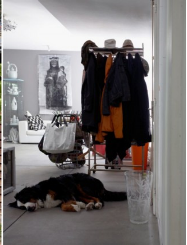
Bild links: Auf den Flachdach vergnügt sich ein Holzpferd, während es Oskar (Bild rechts) draussen nun eindeutig zu warm findet. Er schläft im eigentlichen Entree; «im Sommer kommen und gehen aber alle durch die Küche», lacht Ewa.