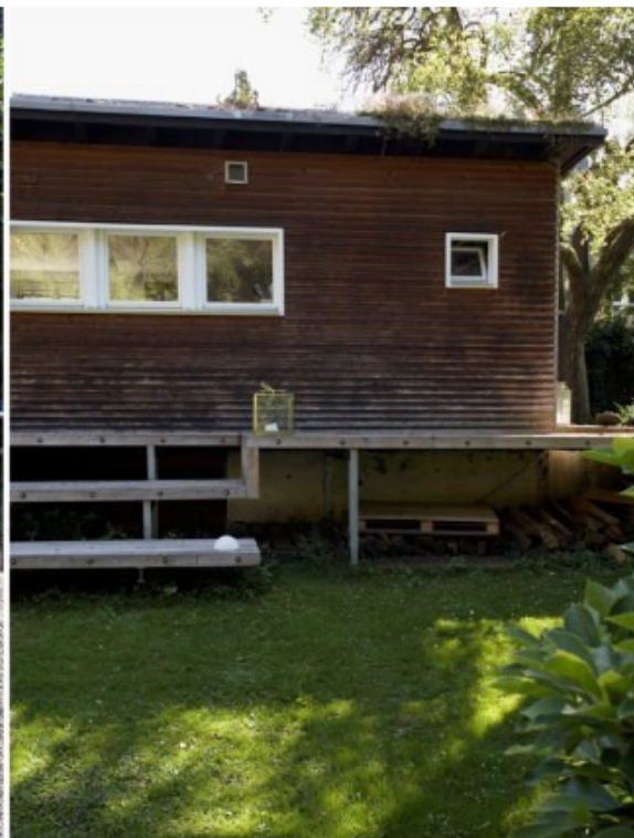
Bild links: eine schöne Idee, die zum Nachahmen inspiriert. Ewa hat eine grosse Schale in einen kleinen Gemüsegarten verwandelt. Darin hat sie Fenchel, Lattich, Radieschen und verschiedene Salate und Kräuter angepflanzt. Bild recht: die Gartenansicht des alten Hausteils mit den grossen Treppenstufen.