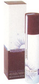
Aus dem Pays-d'Enhaut bei Gstaad: Crème Baume d'Orient von Valdorex