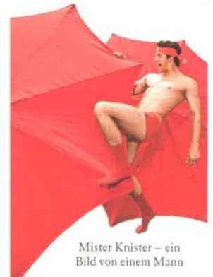
Mister Knister – ein Bild von einem Mann