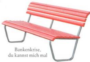
Bankenkrise, du kannst mich mal