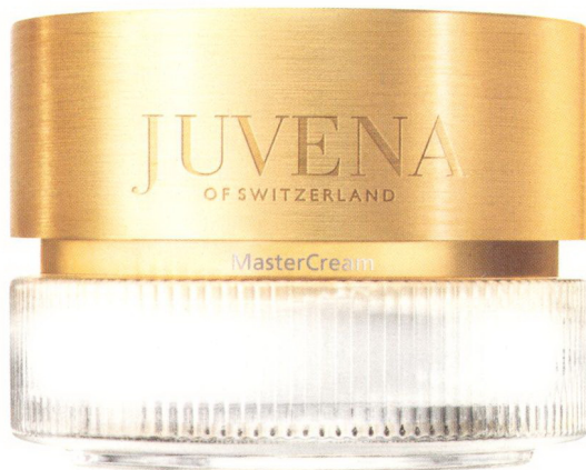
Die traditionsreiche Pflege aus dem zürcherischen Volketswil im neuen Look: Master Cream von Juvena