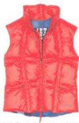
Look vo Bärge und Tal