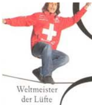
Weltmeister der Lüfte