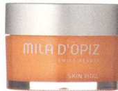
Skin Vital von Mila d'Opiz, dem Spezialisten für Beautysalons