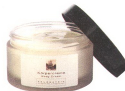
Beauty aus dem Engadin: Körpercreme von Feuerstein Essentials