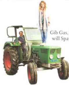
Gib Gas, ich will Spass!