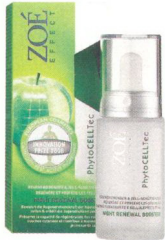
Die Pflege mit dem Thurgauer Apfel: Zoé Effect von Mibelle