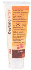
Sonnenklar: Schutz für den ganzen Tag! Daylong von Spirig (gegr. 1948)