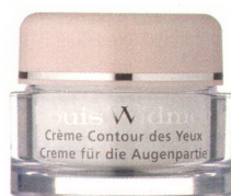
Crème für die Augenpartie von Louis Widmer (gegr. 1960)