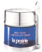
Skin Caviar Luxe Eye Lift Cream von La Prairie, dem Schweizer Highend-Beautylabel