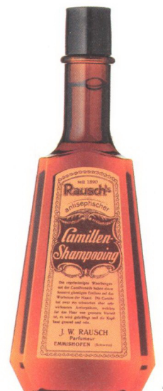
Camillen-Shampooing von Rausch – gut fürs Haar seit 1890