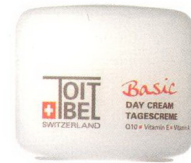
Basic Tagescreme von Toitbel, dem Kosmetikunternehmen mit dem Credo «Swissness von A bis Z»