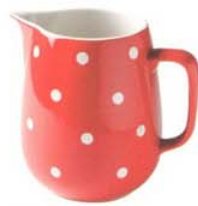
Nichts für Tüpfelschüsser