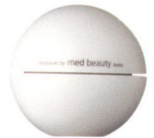
Gesichtscreme Cell Premium Rich von Med Beauty (gegr. 1991)