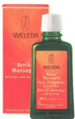
Naturkosmetik der ersten Stunde: Arnika-Massageöl von Weleda