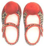
Wir haben die Tigerfankli im Tank